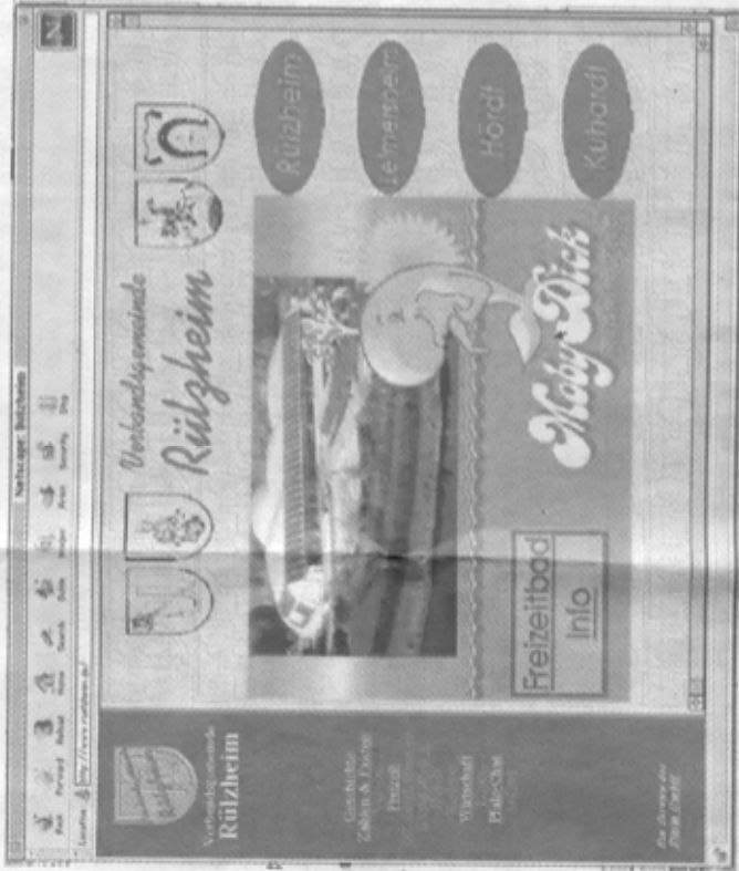
Die „Eiersammler“ aus Unnerkannel, das Freizeitbad Moby Dick, der Flugmodellclub Hatzenbühl oder die Uni Germersheim – sie alle sind bereits im Internet präsent. Wer „surft“, wird zuweilen aber noch enttäuscht über das oft spärliche Angebot aus den Gemeinden sein.