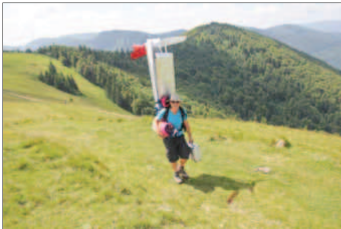
Aufstieg zum Startplatz