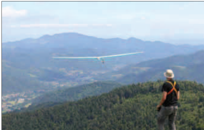
Start in den Aufwind