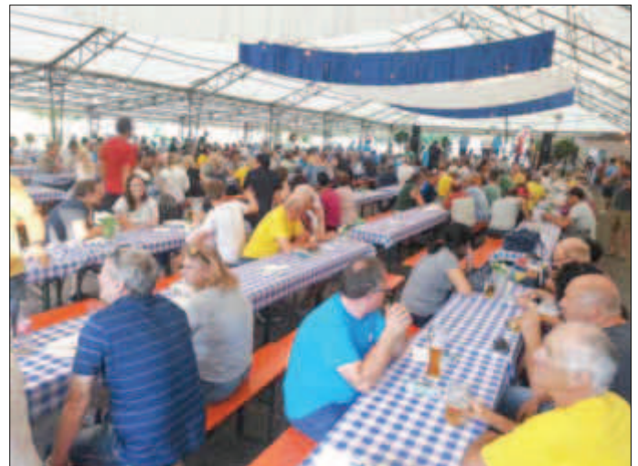
Immer gute Laune im Festzelt in der Schelmenhecke. Egal ob mit Band am Abend oder dem Musikverein zu Frühschoppen oder den Teamvorstellungen - es war immer viel los!